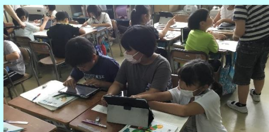
第2回「大郷小の算数の授業(4年)」

2学級で「角の大きさの表し方を調べよう」の研究授業を行いました。学級の実態に応じて問題場面を変えることで、どのような学習効果があるかを検証する、提案性のある授業でした。2学級とも、問題に問いを持ち、子供たちが学び合う姿が見られました。