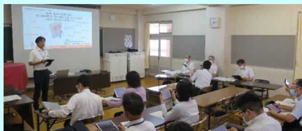
第1回「大郷中で行った研修会」

2学級で「角の大きさの表し方を調べよう」の研究授業を行いました。学級の実態に応じて問題場面を変えることで、どのような学習効果があるかを検証する、提案性のある授業でした。2学級とも、問題に問いを持ち、子供たちが学び合う姿が見られました。