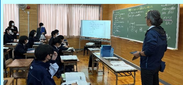
第2回「大和中の数学の授業(1年)」

「比例と反比例」の授業実践が行われました。反比例の表から式を求める過程や、グラフから式を求める過程をペアや全体で共有することができました。