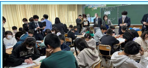
第4回「小野小の算数の授業(6年)」

「比例の関係をくわしく調べよう」の授業実践が行われました。身近な題材を取り上げて比例の関係に注目させ、ICTを活用して意見を共有させることができました。