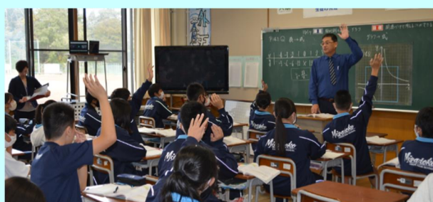
第1回「宮床中の数学の授業(1年)」

「比例と反比例」の授業実践が行われました。反比例の表から式を求める過程や、グラフから式を求める過程をペアや全体で共有することができました。