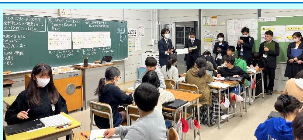
第3回「吉岡小の算数の授業(6年)」

「比例と反比例」の授業実践が行われました。プールに水を入れるとき、時間と水位の数量関係を説明するために、効果的にICTを活用した授業でした。