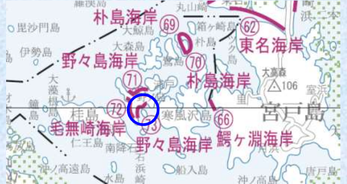
東日本大震災で 破損した海岸堤防