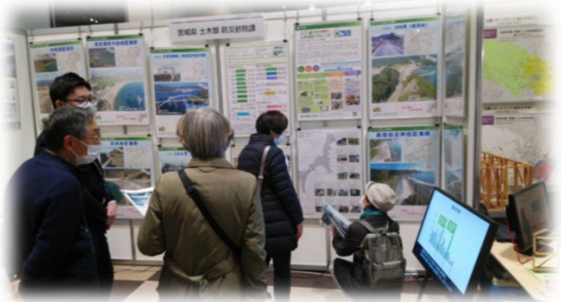
令和4年度復旧・復興パネル展（仙台防災未来フォーラム）

【WEB版】復旧・復興パネル展はこちら↑スマートフォン等で上記のQRコードを読み取ってご覧ください。