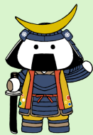
仙台・宮城観光PRキャラクター「むすび丸」

Instagramアカウントではツアー情報や宮城県職員農業系職種の仕事についても情報を発信中！ぜひ、合わせてチェックしてみてください！！