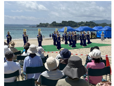
ハワイアンフェスティバル2025