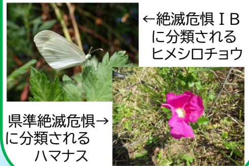
←絶滅危惧IBに分類されるヒメシロチョウ