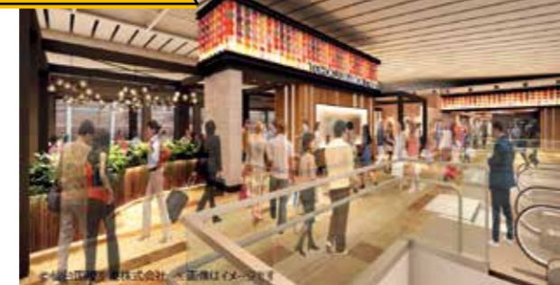
東北の食材にこだわったメニューでおもてなし