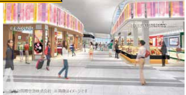
宮城・東北の逸品が並び、お土産選びもより楽しく