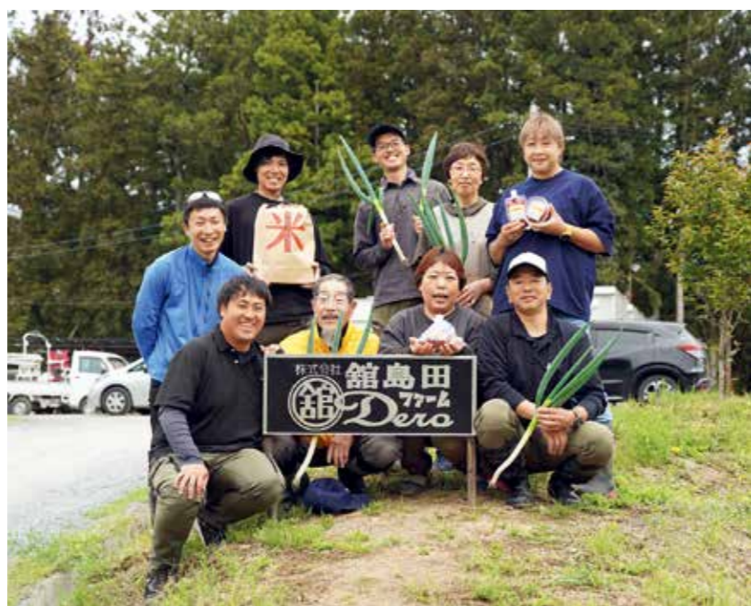
株式会社館島田ファーム Deroの皆さん。「Dero (でる)」という社名は、「泥 (どろ)」の訛りの響き由来しています。この土壌から、米、ネギ、梅、赤シソ、大麦など、多彩な作物を丹精込めて育てています。