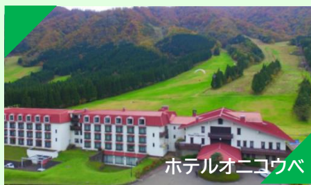
ホテルオニコウバ