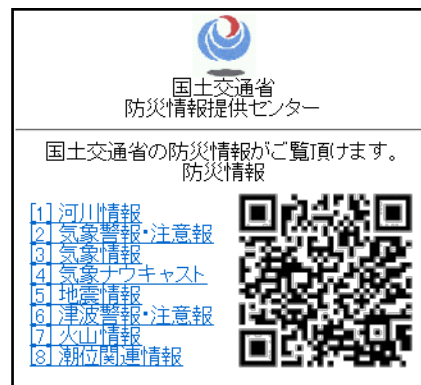
防災情報提供センター 携帯端末向けホームページ (Top)

https://www.mlit.go.jp/saigai/bosaijoho/i-index.html