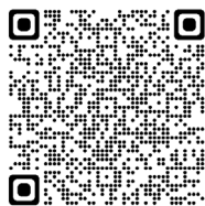
噴火速報について