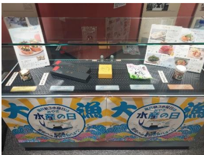
宮城県水産加工品評会受賞商品の紹介