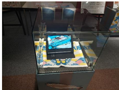
タブレット端末による宮城の水産業等紹介動画の放映