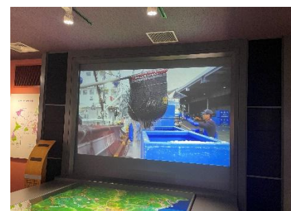
大型スクリーンでの産地魚市場紹介動画放映

※耳石：魚の頭蓋骨内、人間の内耳に当たる部分にある平衡感覚を司る炭酸カルシウムの結晶で、耳石の形や大きさは魚の種類によって異なり、「魚の宝石」と呼ばれています。