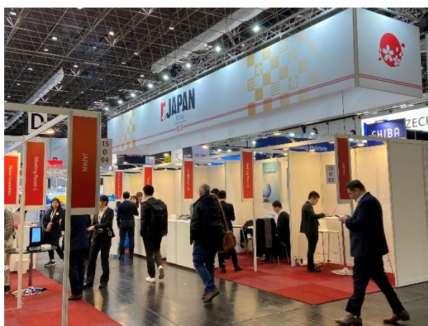
MEDICA2025 ジャパン・パビリオン

出品料には、ジャパン・パビリオンカタログや主催者カタログへ貴社出品物の掲載費用も含まれます。また、ドイツ・欧州企業とジャパン・パビリオン出品企業と交流できるサイドイベントを実施予定です。