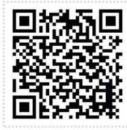
基礎調査結果公表 公式サイト