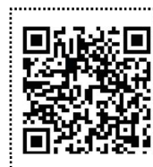
説明動画 (20 分程度)