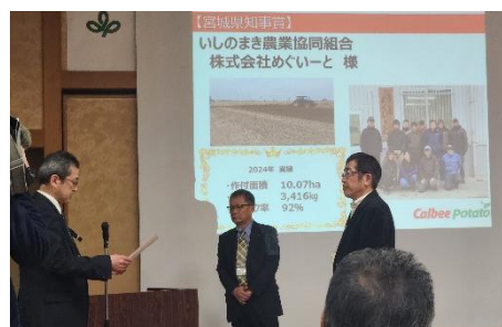
昨年度の表彰式の様子