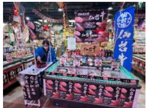
仙台牛フェアの様子（令和7年9月）