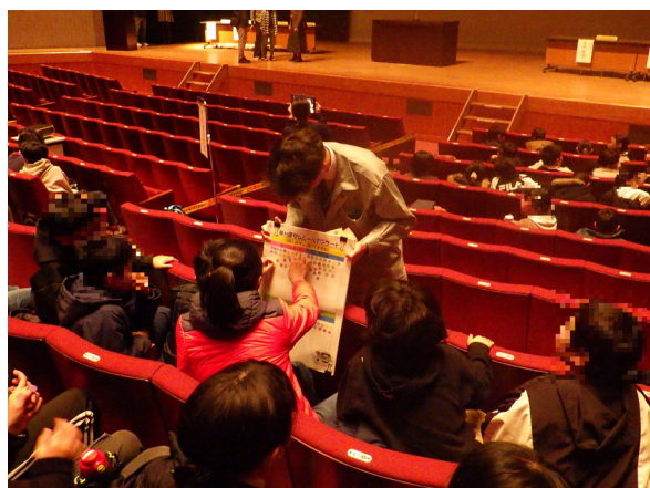
多くの児童にアンケート調査を実施しました。