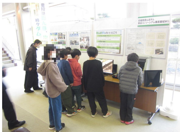
児童も前のめりになって見つめていました。