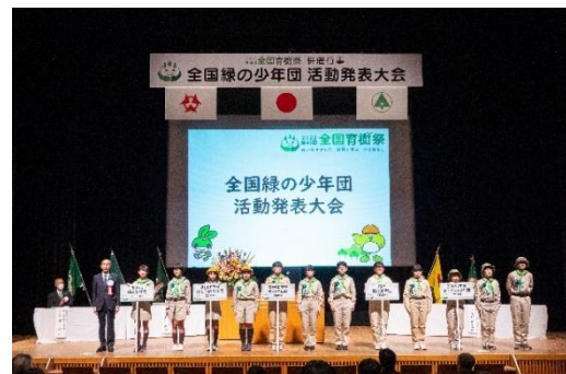
全国緑の少年団活動発表大会 (令和4年：大分県)