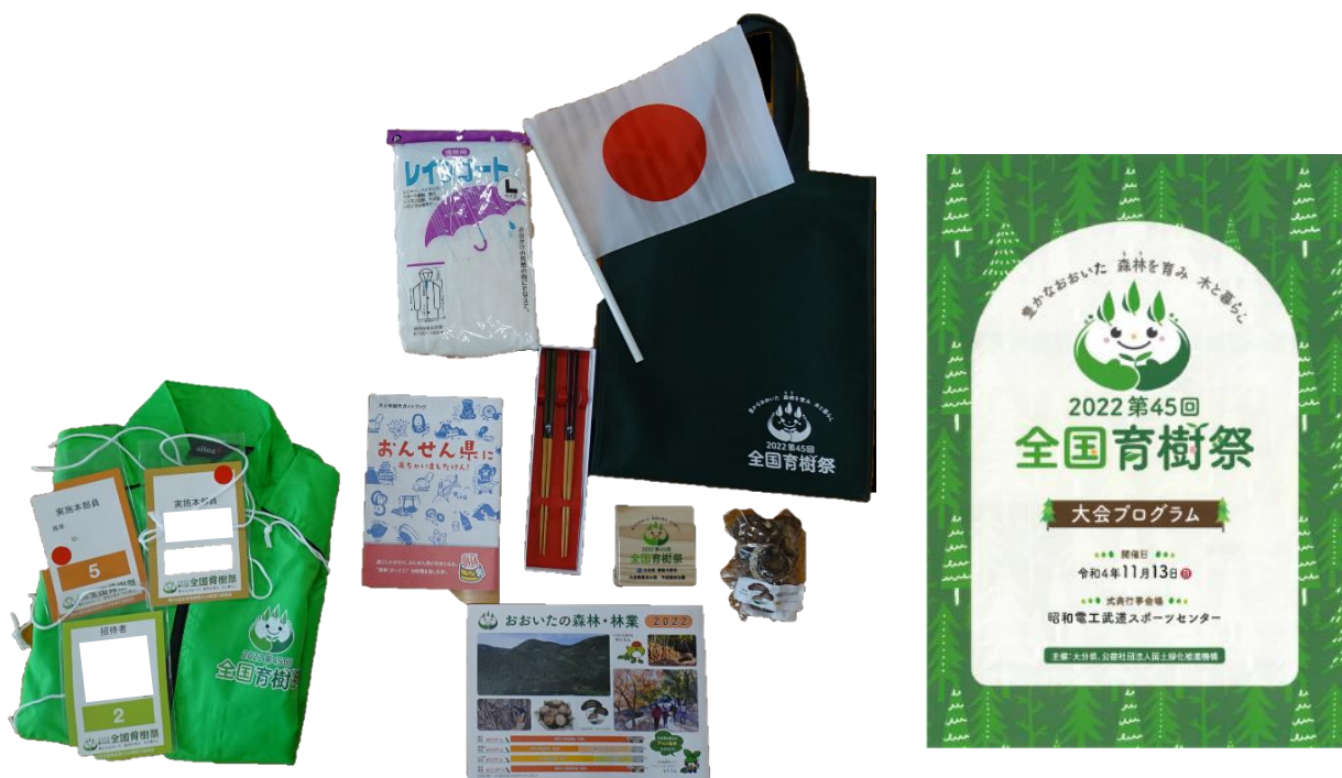
参加記念品及び大会パンフレット等（令和4年：大分県）

第48回全国育樹祭への参加を記念し、本県らしい記念品を贈呈します。また、会場で使用する物品のほか、本県の取組、名所等を紹介するパンフレットなどを配布します。