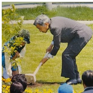
第48回全国植樹祭の様子

平成9年5月18日に白石市（国立花山青少年自然の家南蔵王野営場）において、天皇皇后両陛下をお迎えして開催しました。「森づくり 大地に託す 夢・未来」をテーマとして、ブナやオオヤマザクラのお手植えや参加者による記念植樹などが行われました。当時、広大な原野であった植樹祭会場は、現在は豊かな森林へと姿を変え、「未来の森」として引き継がれています。