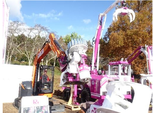
森林・林業・環境機械展示実演会 (令和4年：大分県)