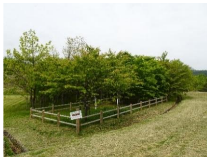
御手植えのブナとオオヤマザクラ