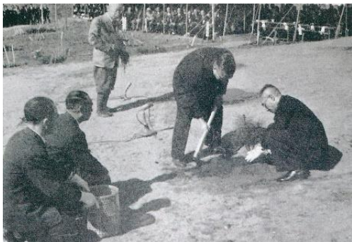
第6回全国植樹祭の様子

昭和30年4月6日に大衡村平林地区において、天皇皇后両陛下をお迎えして開催しました。「林種転換拡大造林」をテーマとして、アカマツのお手植えや参加者による記念植樹などが行われました。現在は、植樹祭を開催した松林（通称、御成山）と隣接する森林が「昭和万葉の森」として整備され、県民の憩いの場となっています。