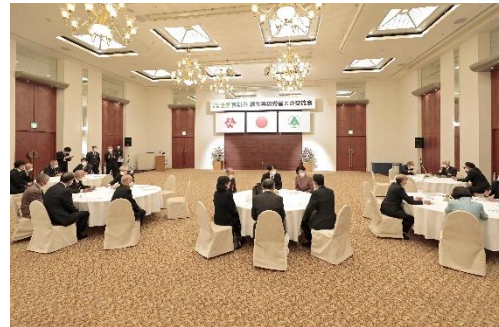
緑化等功労者との交流会 (令和4年：大分県)