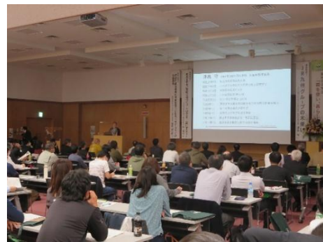
育林交流集会 (令和4年：大分県)