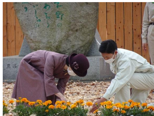
第45回全国育樹祭のお手入れ行事の様子（令和4年：大分県）