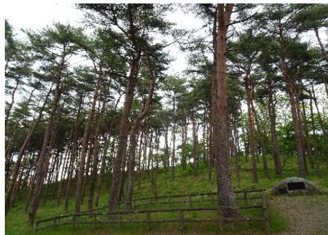
御手植えのアカマツ