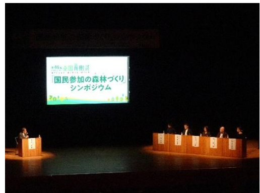
国民参加の森林づくりシンポジウム (令和4年：茨城県)