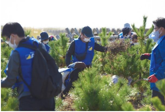
海岸防災林保育活動

県が実施するイベントのほか、市町村や関係団体等が実施する関連イベント等を第48回全国育樹祭の記念行事と位置付け、第48回全国育樹祭の開催機運醸成のための取組を進めます。