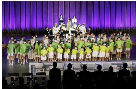
第45回全国育樹祭の式典行事の様子 （令和4年：大分県）