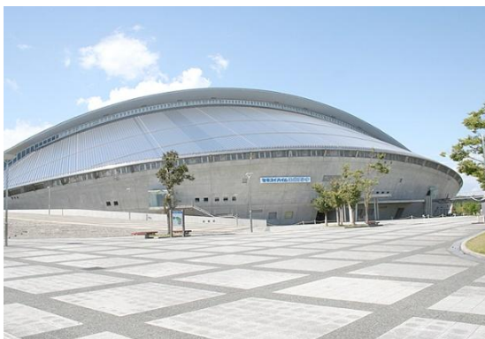
セキスイハイムスーパーアリーナ （宮城県総合運動公園総合体育館）

式典に参加いただいた方への感謝の意を込め、式典行事のフィナーレを飾るに相応しいアトラクションを企画、実施します。