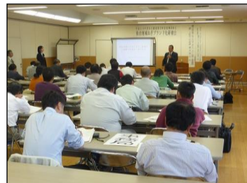
←仙台地域ねぎブランド化研修会 (「ねぎ」の生産拡大に向けて先進事例を学ぶ)