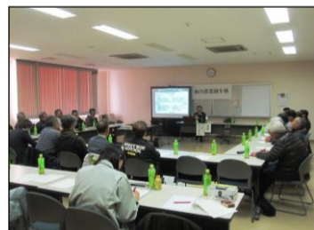
←仙台農業創生塾 (法人経営における人材育成と定着手法を学ぶ)