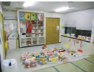
みやぎっこ保育園