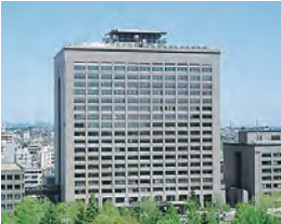
県庁(仙台市青葉区)