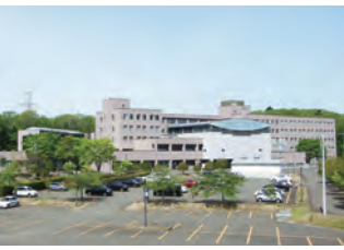
公務研修所(東北自治総合研修センター内)

宿泊施設を併設し環境の整った快適な研修施設で、公務員としての基礎から仕事に必要な様々なスキルまで幅広く学ぶことができます。職位ごとに身に付けておくべき能力を修得するための「階層別研修」と、職員の自律的な能力開発のための「選択制研修」を実施しています。