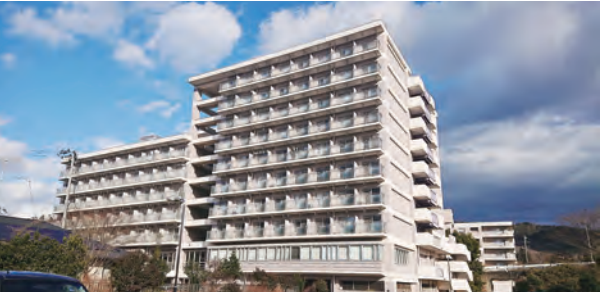
下愛子県職員寮(仙台市青葉区)

世帯用の職員住宅や独身・単身用の職員寮が設置され、生活の拠点として利用されています。