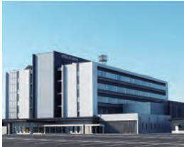
石巻合同庁舎(石巻市)