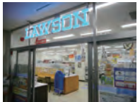
県庁 2階コンビニエンスストア