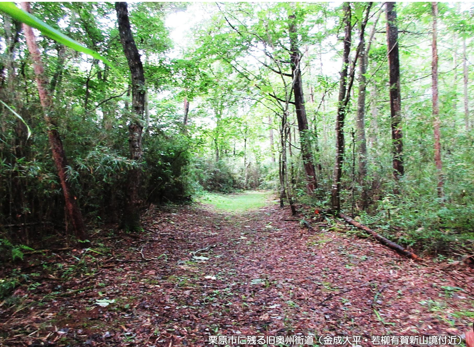
栗原市に残る旧奥州街道（金成大平・若柳有賀新山境付近）