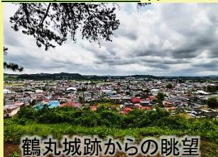
鶴丸城跡からの眺望

■ コース: 9:30山の駅くりこま発~鶴丸城跡~栗駒小学校(鶴丸館跡)~下小路~黄金寺~ (昼食)~上堰~館山寺~上小路~御仮屋跡~円鏡寺~軽辺堰~六日町通り~馬場通り ~山の駅くりこま着15:00予定 (徒歩計約5km)