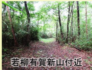
若柳有賀新山付近