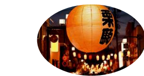
地域商店街でのナイトタイムイベント