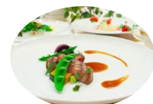
地域食材を活用した インバウンド向けメニュー