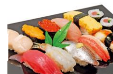
ネタもシャリも全て宮城産