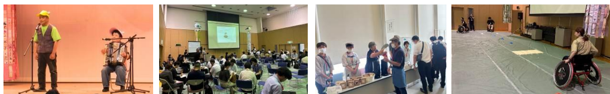
昨年度のコンファレンスの様子