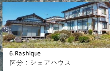
6. Rashique 区分：シェアハウス