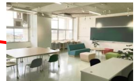
3. ITベース大島アスナロウ荘 区分：シェアオフィス