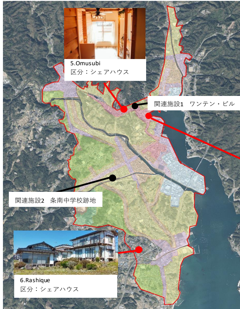
5. Omusubi 区分：シェアハウス