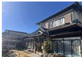
4. つんばり 区分：シェアハウス