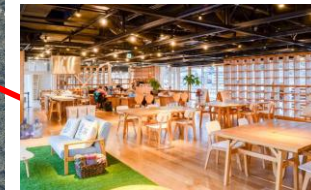
1. 気仙沼市まち・ひと・しごと交流プラザ 区分：コワーキングスペース