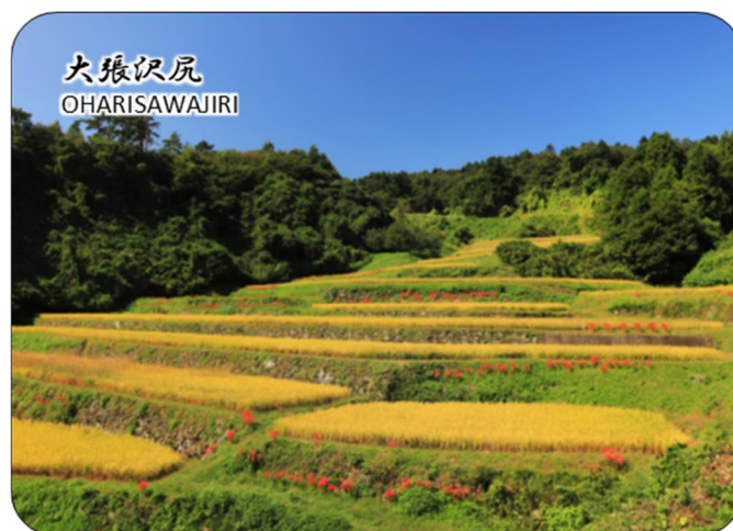
棚田カード（丸森町大張沢尻）