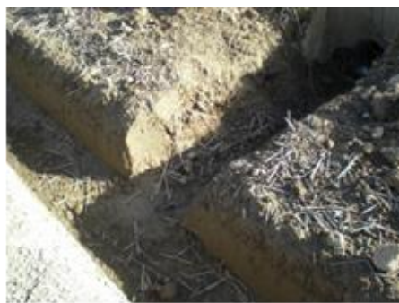
写真 1 明きよと排水溝をつなぐ