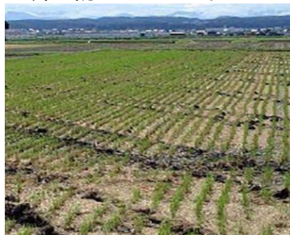
写真 2 心土破碎後のほ場