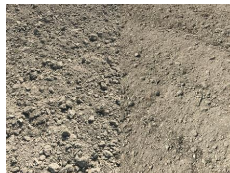
写真 3 碎土率の異なるほ場表面 (左: 60%、右: 70%)