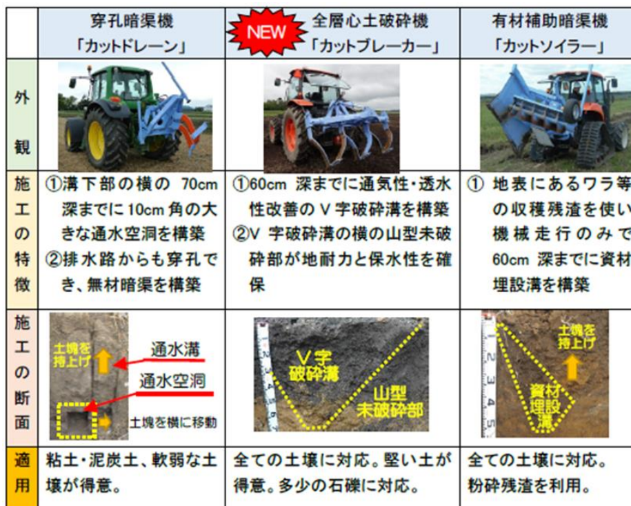
表1 「カットシリーズ」の詳細