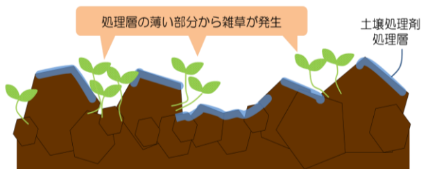
図2 砕土不良による雑草発生