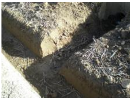
写真1 明きよと排水溝をつなぐ