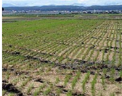
写真2 心土破碎後のほ場