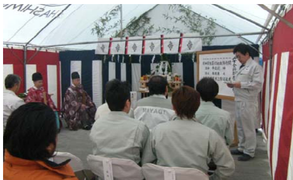
(仮称)二ノ浜2号トンネル安全祈願

大島架橋本体工事へのアプローチについては、本土側で昨年11月に三ノ浜道路改良工事が契約となり、（仮称）二ノ浜2号トンネルから架橋位置までの道路改良工事の施工が進む予定です。大島側では、（仮称）磯草トンネル工事にて、架橋位置までの工事用道路の施工が進み、大島架橋が取り付く位置が分かる状況となっております。