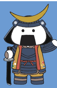
仙台・宮城観光PRキャラクターむすび丸

気仙沼市建設部 計画・調整課 〒988-8501 宮城県気仙沼市八日町一丁目1番1号 電話: 0226-22-6600 E-mail: keikakuchosei@kesenuma.miyagi.jp URL: https://www.kesenuma.miyagi.jp/index.html