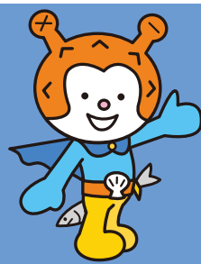
気仙沼市観光キャラクター「海の子ホヤぼーや」

宮城県気仙沼土木事務所 大島架橋建設班 〒988-0181 宮城県気仙沼市赤岩杉ノ沢47番6号 電話: 0226-24-2537 E-mail: ksdbkok@pref.miyagi.lg.jp URL: https://www.pref.miyagi.jp/site/oshimakakyozigyo/