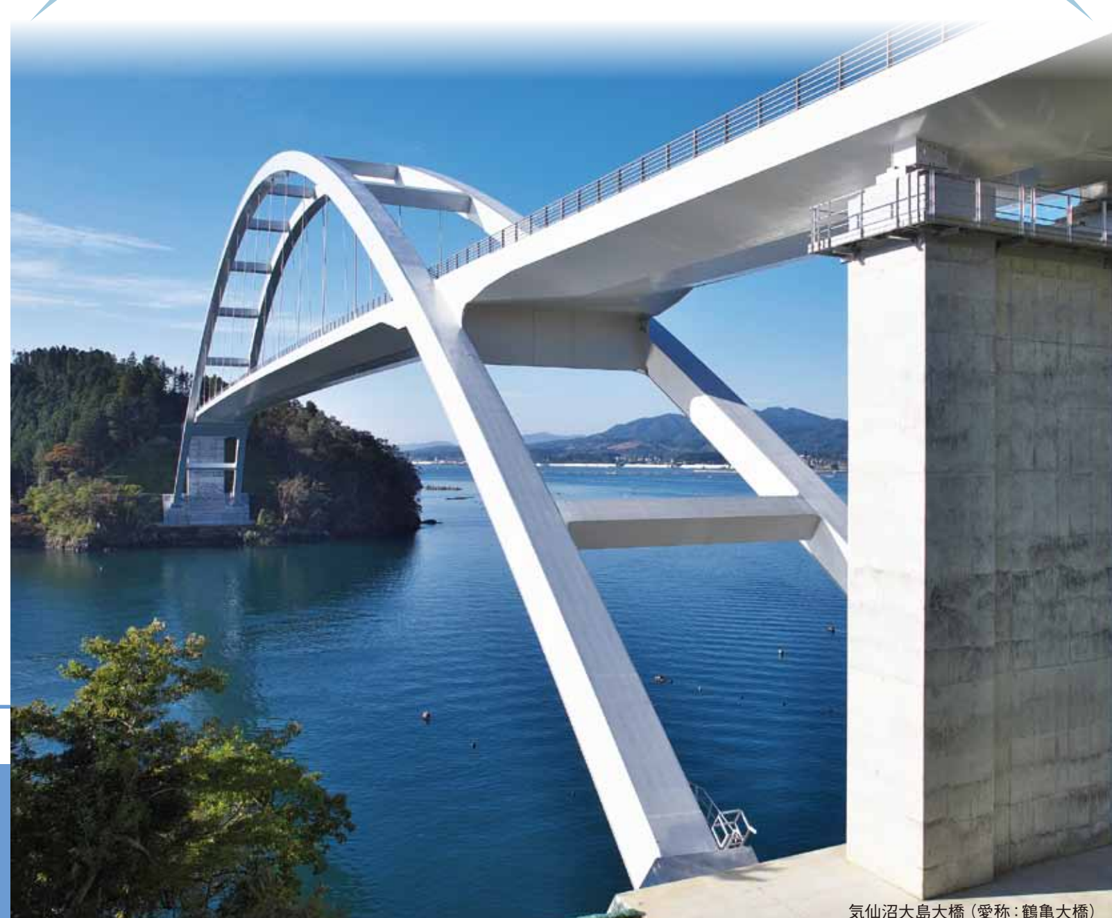
気仙沼大島大橋(愛称:鶴亀大橋)