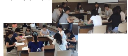
参加者の研究協議