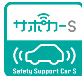
サポカーS キャンペーンロゴ