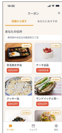
▼ アプリ画面イメージ