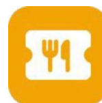
「フードロスクーポン」のアイコン

「ポケットサイン」を開き、ミニアプリの アイコンをタップし、利用規約等に同意 すると、「フードロスクーポン」が利用で きます。