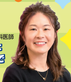
元サッカー日本女子代表 澤 穂希さん