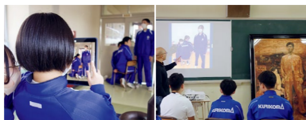
ポーズを指示しながら撮影中

作品を鑑賞した後は、グループに分かれて人物のポーズを真似て写真を撮る表現活動を行いました。モデルと撮影者に分かれ、撮影者はポーズについてあれこれと指示を出し、一度撮影した写真をみんなで見てさらに修正するなど忠実に再現しようという様子がどのグループにも見られました。顔や手などのパーツのみを再現しているグループもありました。