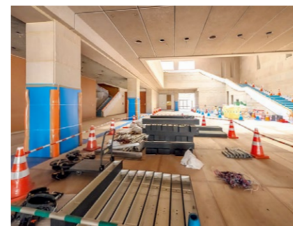
本館エントランス

現在館内各所では、建物の床や柱、屋外彫刻を保護した上で、解体工事などが行われています。