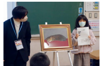
みんなの前で履歴書を紹介

授業後の児童の感想には、「作品を見るだけでなく、自分達でかいたりしてすごく楽しかった」「絵の見方を知れてうれしかった