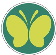
【聴覚障害者標識 (聴覚障害者マーク)】 所管：警察庁