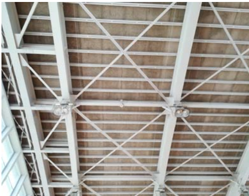
天井面の雨漏りあと。