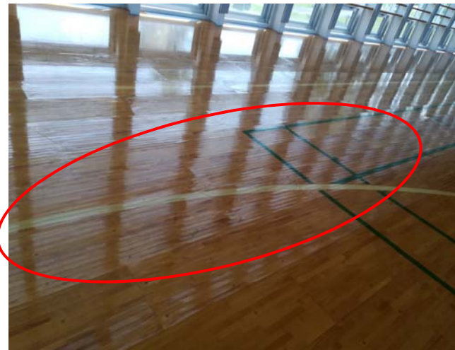
フローリングに劣化がみられます。