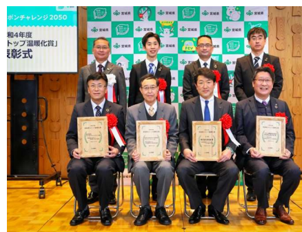
▲昨年度の表彰式の様子