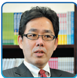
川島 隆太 教授

2005年~2019年NHK Eテレ「おかあさんといっしょ」第11代目体操のお兄さんを歴代最長14年間務める。卒業後も得意な料理や運動能力を活かし、イベント、バラエティ番組出演。