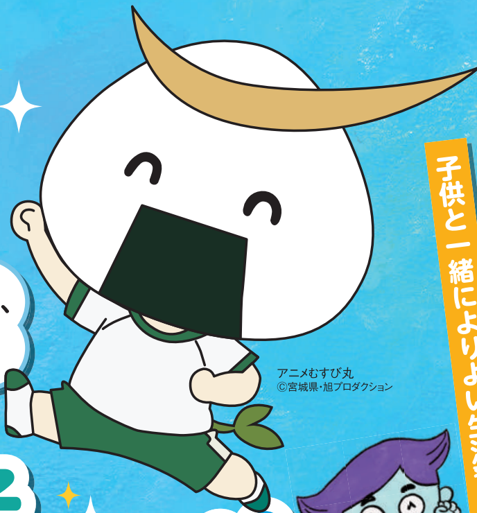
アニメむすび丸 ©宮城県・旭プロダクション

健やかな 子供の成長 のために、 規則正しい 生活のリズム を 社会総ぐるみ で