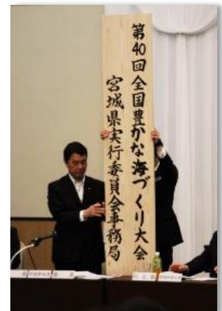
参考3 R3 海づくり大会看板