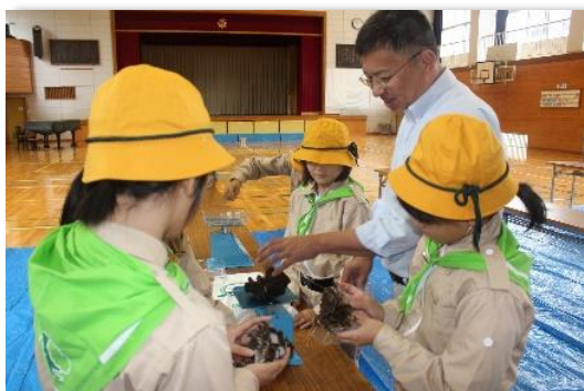
参考1 米川小学校みどりの少年団活動状況 (米川里山だより HP より)