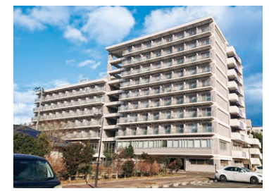
下愛子県職員寮(仙台市青葉区)

世帯用の職員住宅や单身・単身用の職員寮が県内各地に設置され、生活の拠点として利用されています。