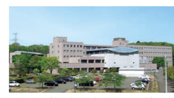
公務研修所(東北自治総合研修センター内)

宿泊施設を併設し環境の整った快適な研修施設で、公務員としての基礎から仕事に必要な様々なスキルまで幅広く学ぶことができます。職位ごとに身に付けておくべき能力を修得するための「階層別研修」と、職員の自律的な能力開発のための「選択制研修」を実施しています。