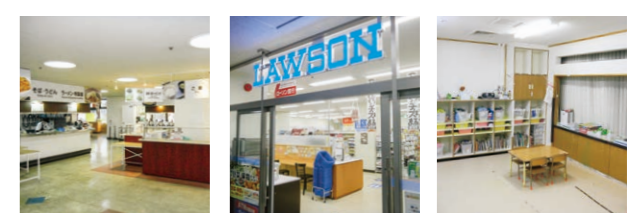
県庁2階食堂 県庁2階コンビニエンスストア みやぎっこ保育園

県庁内には、職員診療所、食堂、コンビニエンスストア、銀行、郵便局などが設置されています。また、職員の子どもなどを対象とした県庁内保育所「みやぎっこ保育園」も設置されています。