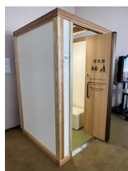
蔵王山頂レストハウス(七ヶ宿町)