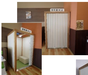
ヨークベニマル石巻蛇田店 (石巻市)