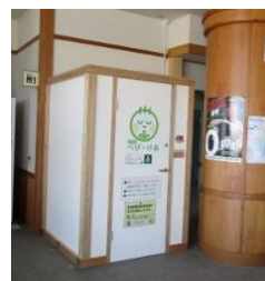
松島海岸レストハウス(松島町)