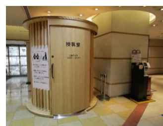
エスパル仙台(仙台市青葉区)