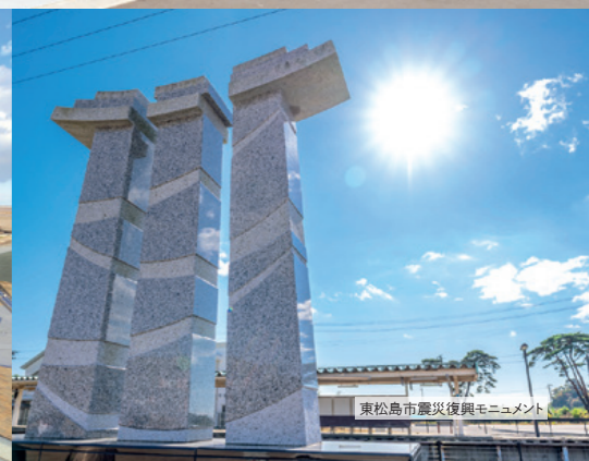
東松島市震災復興モニュメント