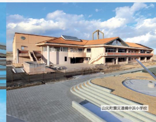
山元町震災遺構中浜小学校