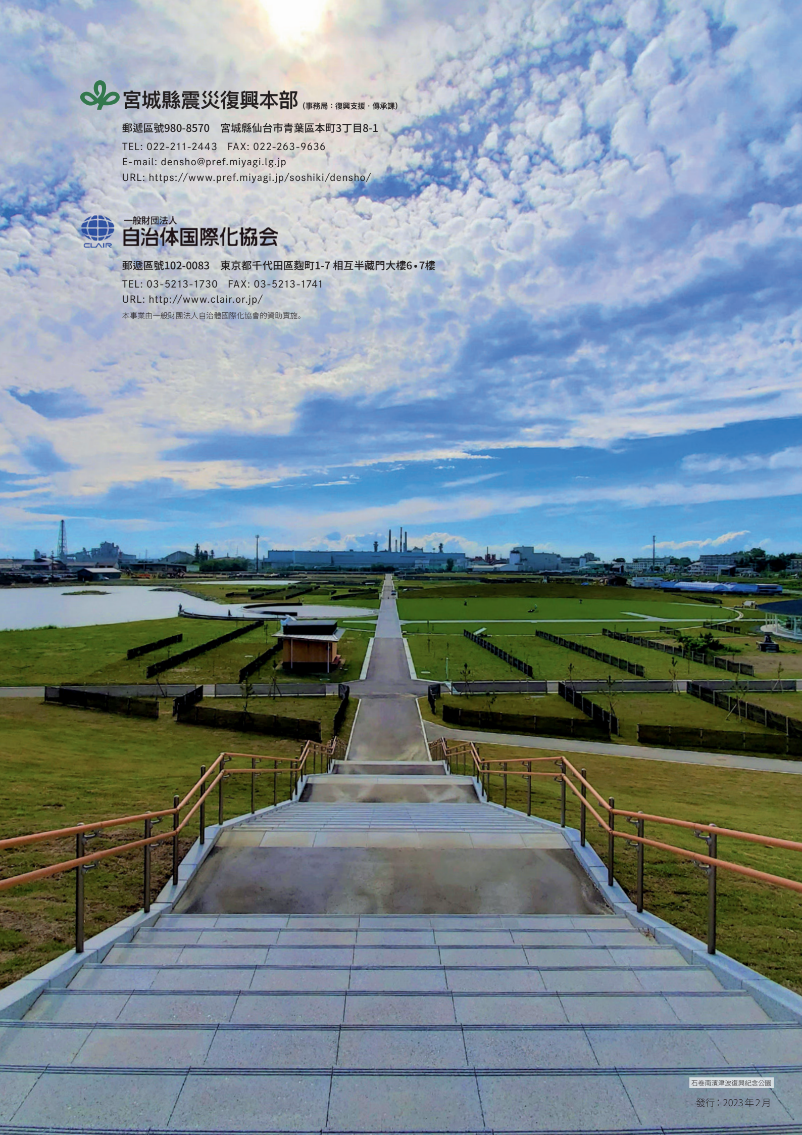
石巻南濱津波復興紀念公園 發行：2023年2月

郵遞區號102-0083 東京都千代田區麴町1-7 相互半藏門大樓6・7樓 TEL: 03-5213-1730 FAX: 03-5213-1741 URL: http://www.clair.or.jp/ 本事業由一般財団法人自治體國際化協會的資助實施。