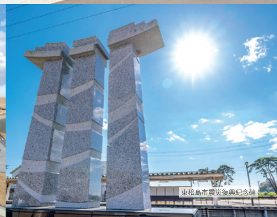
東松島市震災復興紀念碑