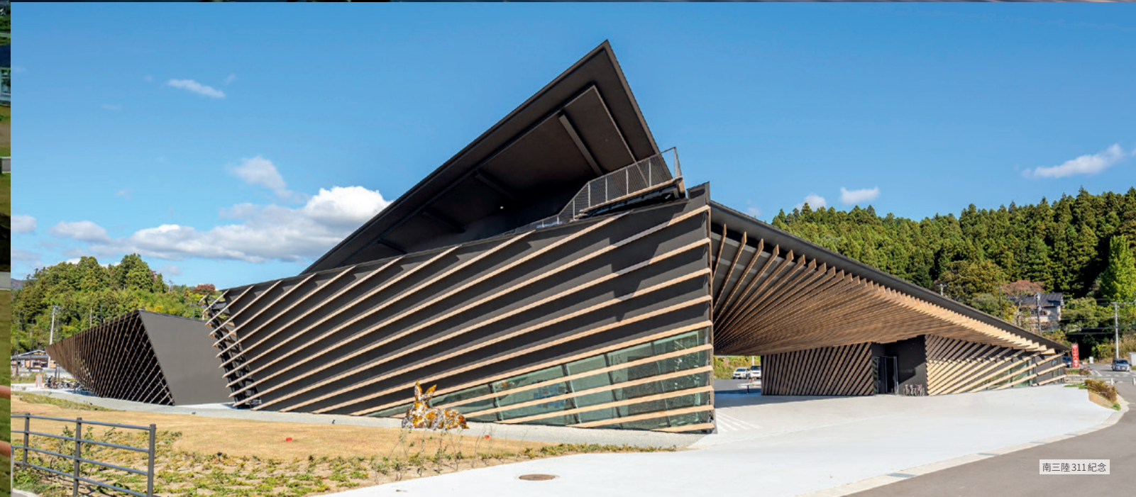
南三陸 311 紀念