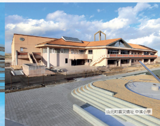
山元町震災遺址 中濱小學