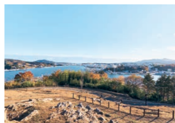
園内に露出している岩は約2億5千万年前(古生代ペルム紀)のもので、ウミユリなどの化石を確認することができる。また、宮城県準絶滅危惧種のオニシバリが自生する。

DATA ◎宮城県気仙沼市陣山264 ☎0226-22-6600(気仙沼市総務部総務課) ◎ご自由に散策ください ※公園を広く利用して次の行為をする際には市の許可が必要です。①物販などを行う場合 ②集会などを行う場合 ③映画などを撮影する場合 🌐https://www.kesennuma.miyagi.jp/memorialpark/