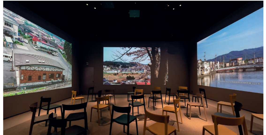
「ラーニングシアター」。入場前に「防災ミニブック」が手渡され、映像を見ながら「自分ならどうするか」を考え話し合う空間。プログラムは60分版と30分版がある。

見るだけでなく「じぶんごと」に行くたびに「気づき」が生まれる場所。2022年10月に開館した伝承施設。志津川湾に面した南三陸町は、これまで幾度となく津波の被害を受け対策に努めてきましたが、東日本大震災では想定をはるかに超える津波に襲われてしまいました。その当時の状況を多数の住民の証言から知ることができます。また、ラーニングシアターは当時の記録や証言を見ながら「自分ならどうするか」を考える参加型プログラムを上映。参加者同士で対話する時間もあり、命を守るための様々な考えに触れることができます。