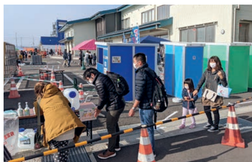
市内のイベント時のトイレとしてマンホールトイレを使用している。組み立てや使用感などを地域住民が自ら体感し、使い慣れる機会にするだけでなく、市・メーカーの情報収集の機会としても活用。

2022年11月時点で、東松島市内16か所に合計137基のマンホールトイレが整備されている。今後も東日本大震災で大きな被害を受けた鳴瀬地区を中心に整備が進められる予定。