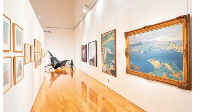
アークギャラリーは東北・北海道ゆかりの作家の美術作品を集めた常設展。気仙沼・南三陸地域の震災以前の姿を描いた作品もあり、地域史の視点からも価値ある展示となっている。