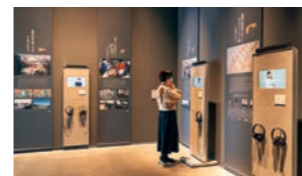
3.11を体験した町民の証言やエピソードを映像や記録から知る「展示ギャラリー」。佐藤仁町長の震災翌日の直筆メモもあり、当時の緊迫感が詳細に伝わる。