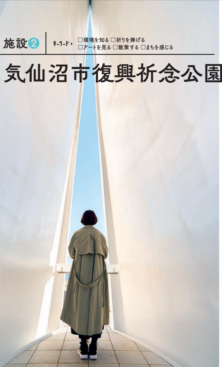
高さ10mのモニュメント「祈りの帆—セーラー」。内部からは水平線を望み、カラーの花があしらわれたプレートの前で静かに祈りを捧げることができる。