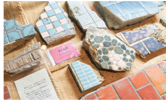
タイルの破片もガレキではなく「被災物」と表現し、暮らしの記憶、地域文化の欠片とし収集・展示。住民の証言をもとに方言で綴られた資料が被災地の状況をリアルに想像させる。

過去の記録と文化の視点から「海とともに生きる」ということを知る 震災以前から災害史を研究してきたリアス・アーク美術館は、美術館の名を冠しながらも、津波を文化に関わる事象と位置づけ、広く地域文化を伝えていきます。 海とともに生きる人々の暮らしと街並み、そして、震災がこの地域にもたらしたものの。気仙沼・南三陸地域の歴史民俗資料、美術作品、「東日本大震災の記録と津波の災害史」という3つの常設展、そのすべてを重ね合わせ、過去に学ぶべきことを問い直す空間です。