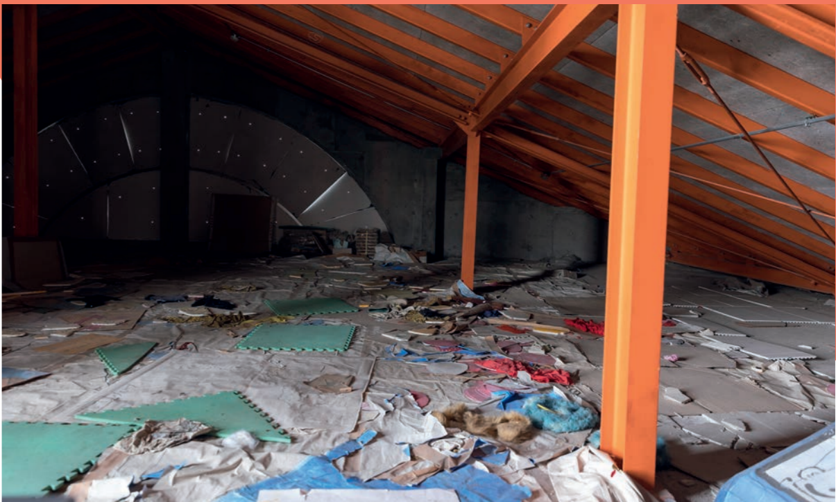
山元町震災遺構中浜小学校で子どもたちや地域住民が避難した屋根裏倉庫。翌朝まで90名がここで身を寄せ合っていた。

身体と心は、密接につながっているもの。どちらかがダメージを負えば、どちらかに影響が出てきます。それをなるべく少なく抑えるには、自分自身での対策と、お互いに支え合うこと、どこかに頼ることも、大切です。