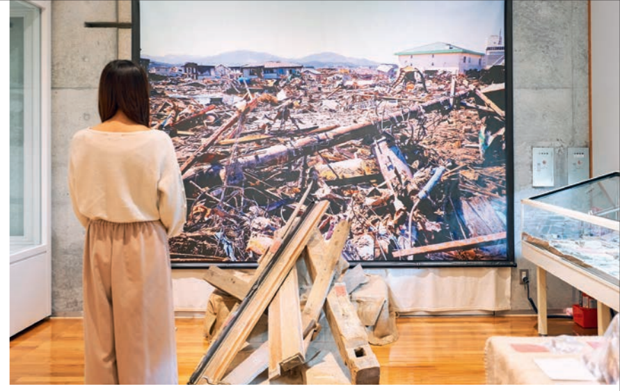
「東日本大震災の記録と津波の災害史」で展示されている写真・被災物は、すべてこの施設の学芸員が撮影・収集した。過去にこの地を襲った津波の記録史料も展示され、自然との向き合い方を考えるきっかけに。