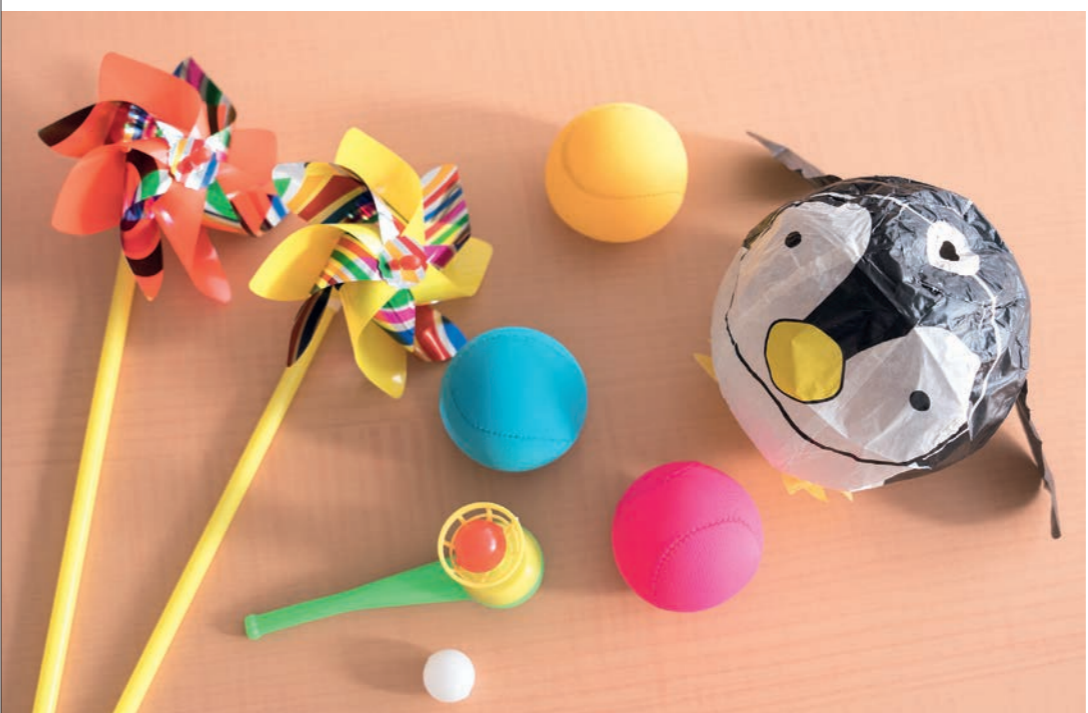
呼吸法に有効なおもちゃと、握ることでリラックスする筋弛緩法のグッズ。場所をとらず周囲を汚すこともないので避難環境でも取り入れやすい。