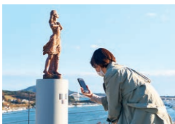
震災を語り継ぐために設置された「伝承彫刻」。現在は3体あり、すべての台座にQRコードが設置されていて携帯電話で読みとるとその彫刻にまつわる物語を読むことができる。