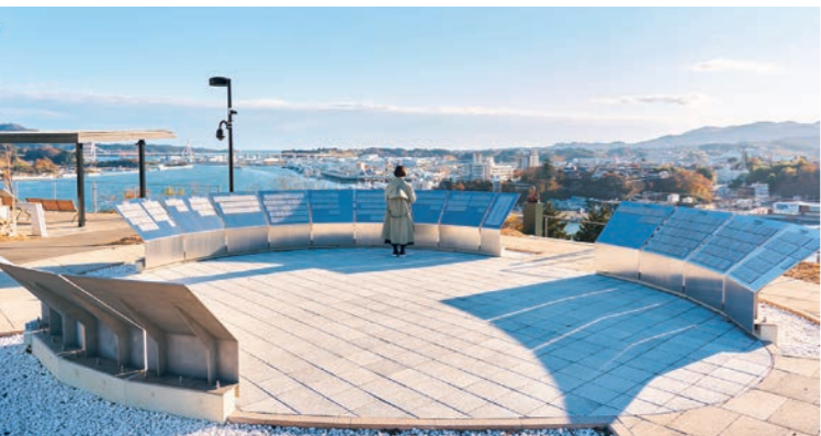
円環状に設置された犠牲者銘板。東日本大震災で犠牲となった方のお名前と当時の年齢が刻まれている。銘された位置は、生前にお住まいだった地区の方角に向かっている。