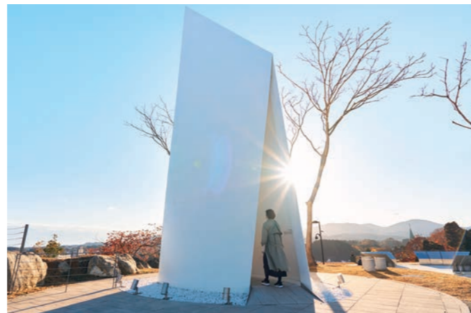
モニュメントは、公園設置時のアイデアコンペ入賞作品を融合させデザインされたもので、アーチ・船・扉・灯台・合掌などを表現している。

気仙沼市のシンボルの一つ「安波山(あなばさん)」の麓に位置し、埋蔵文化財や化石などが多く見られ、歴史的な特徴がある場所です。戦国時代には戦の陣が張られたとも言われています。震災時は、近隣の方々が避難した場所でもありました。市街地からほど近く気仙沼の海と街並みを見渡せる立地を生かし、多くの方々の寄附により祈りの場として整備されました。園内に配置された彫刻が伝承を担い、被災した人々の心の記憶や感情を静かに伝えます。