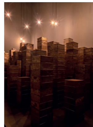
フランスを代表する現代美術家、クリスチャン・ボルタンスキー氏のインスタレーション空間「MEMORIAL」。震災直後に被災地を訪れた体験から生み出された。