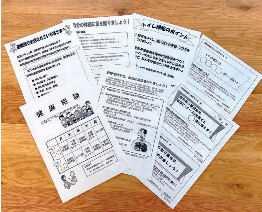
震災当時、保健師たちが手作りし避難所での掲示や在宅避難の方への配布を行っていたチラシ。健康状態のチェックを促すものや、食中毒の注意を呼びかけるクイズ形式のもの、トイレ掃除のポイント、相談窓口開設のお知らせなど。