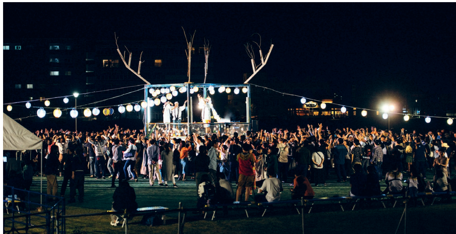
地域の方たちと協働して盆踊りをRAF的に再構築した「リボーン祭り」

「誰にでもわかりやすいものは課題解決を論理的かつ合理的に考えることができますが、それを突き詰めるだけでは豊かさは実りにくいと思うのです。つまり、無駄なものさえも大事にする余裕や価値観がないと、地方に人は呼び込めないのではないかと。アートを大事にするローカルだったら私も行ってみたい」と思う人たちはきつといるはず。RAFではそうした考えをこれ