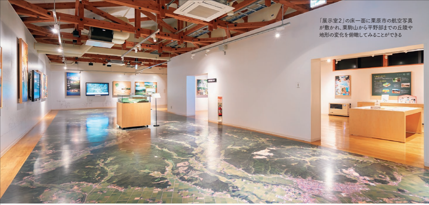
「展示室2」の床一面に栗原市の航空写真が敷かれ、栗駒山から平野部までの丘陵や地形の変化を俯瞰して見ることができる