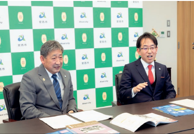
「修学旅行を通して有意義な防災学習につながれば」と日永市長(写真右)

ド面だけでなくソフト面での対策、つまり防災教育が大きな鍵を握ります。中学生体験学習事業検討委員会においても、地域の次代を担う世代が災害に関する直接的な体験をすることは、被災をじぶんごととしてとらえ、ひいては郷土愛を育む効果もあるという声があがりました。それが