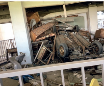
中学生たちがまとめた修学旅行のレポートから一部抜粋。宮城で被災地を巡ったことにより、「もし自分たちの町に災害が起きたら」とじぶんごと化して考えることにつながっている

・気仙沼 伝承館 私は地震に対する恐怖を持っていましたが、揺れに気をつければなんとかなると思っていました。しかし、それは勘違いだと気づかされたのです。東日本大震災では、震度7の揺れで停電が起きました。その後学校の3階の天井まで津波がきたそうです。どんな家も、車も、人までもが黒い津波によって流されたのです。さらに、津波を免れた人々に追い打ちをかけるように火事が起きました。地震の怖さは、揺れだけではないと知りました。 ・伝承交流施設MEET門脇 特に印象的だったのは、「地震が起きた後、丘の上にある幼稚園から子供たちを親に返すため丘を降り、津波の巻き添えになった」と言う話です。聞いたとき私は「なんで?」と思いました。「大きな地震が起きたら津波が来るかもしれない、と思うはずなのに。」私たちはこの悲劇が二度と起きないようにしなければいけません。そして、生きたくても生きられなかった命があることを絶対に忘れません。 ・生活に生かすこと 気仙沼市に建てられているある石碑には、こう書かれています。「大地がゆれたらすぐ逃げろ より遠くへ より高台へ」もし私たちが住む愛西市で大地震が起きたら、津波がさかのぼって来る可能性のある善太川や日光川から離れた避難場所(コミュニティセンター)にすぐに逃げようと思いました。また、道路が渋滞するため徒歩で移動したり、近所の人に声をかけたりすることを忘れないよう注意します。