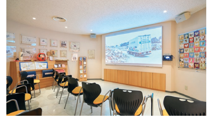
シアタールームでは、発災後の混乱の中、店舗での販売と宅配で地域の人々を支えたみやぎ生協の取組みを映像で伝える。