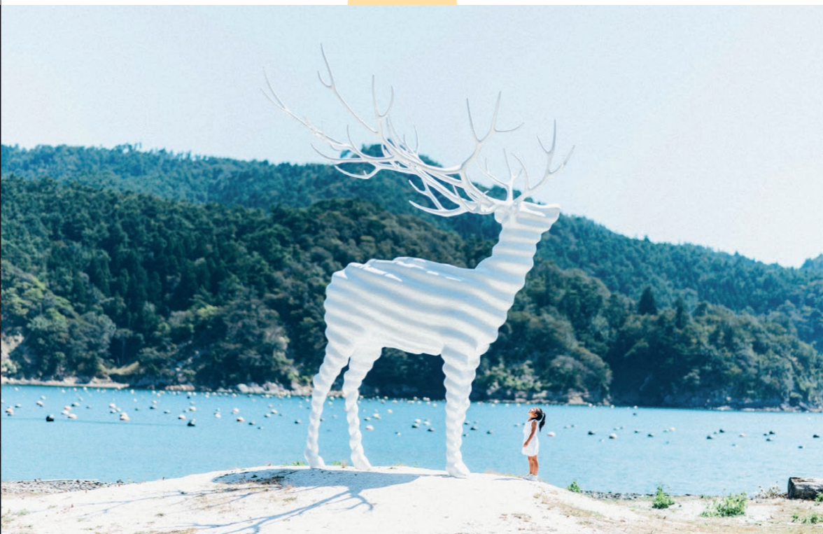
RAFを象徴する常設作品『White Deer (Oshika)』(名和晃平)