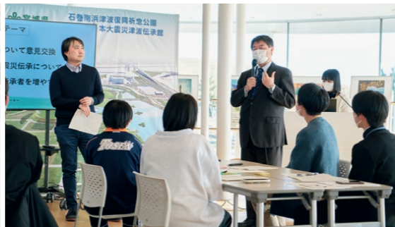
〈上〉みやぎ東日本大震災津波伝承館のボランティア解説員による解説を聞きながら石巻の被害を知る〈下左〉これまでの回を経て様々な伝承のスタイルを知った参加者。これからの伝承についてもアイデアが膨らむ。〈下右〉宮城県復興支援・伝承課からも「中高生の柔軟な意見がたくさん出てとても有意義なプロジェクトだった」と講評が。

ボランティア解説員になる前は、現場（被災地）の雰囲気や震災伝承が抱えている課題を感じることがありませんでした。しかし、解説員に認定され活動が増えていくたびに、現場の雰囲気や課題をじぶんごととして感じるようになりました。震災伝承活動には、多くの人の想いが詰まっています。震災のことについて語りたくない方、語れない方もいらっしゃると思います。皆さんの想いを決して忘れることなく、これからも伝承者として携わっていきます。