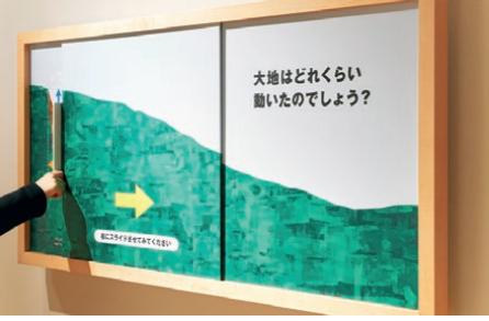
地すべりで大地がどのくらい動いたかを解説する仕掛け展示。人間や車との対比が描かれ、その規模を体感できる

問 岩手・宮城内陸地震によって起こった荒砥沢地すべりで、大地はどのくらい動いたでしょう？