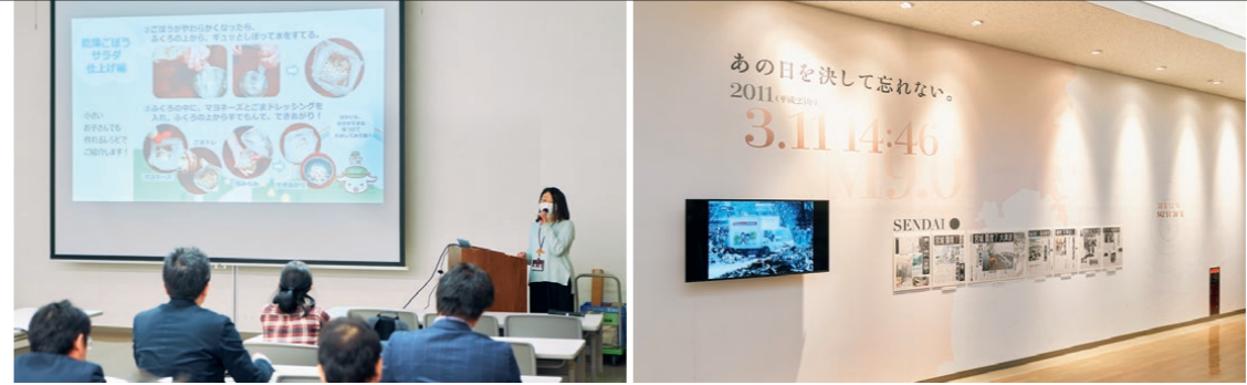
〈上右〉資料室の外には、震災当日の夜に河北新報社が出した号外やその後数日間の新聞を掲示。当時の緊迫した空気を伝える。〈上左〉被災地を巡るツアーの一部として行われた防災講座。この日はローリングストックの仕組みを通じて備えることの重要性を呼びかけていた。

暮らしを守るために 助け合った軌跡 東日本大震災を忘れないために。そして、あの日からの歩みを後世に伝えるために。その責務のために設置されたこの資料室は、被災の痕跡をデータと多数の写真で展示。さらに、地域と生活者の日常を支えるために奔走したみやぎ生協の取組みについて発信する場所です。阪神・淡路大震災をはじめ全国各地で発生した災害から教訓を得て今につながっているという物資の支援、人と人がつながる場づくり、再起を目指す事業の支援などの様子からは、発災から14年間で成し遂げられた再興の過程と、何気ない日常を過ごせることの尊さが伝わります。