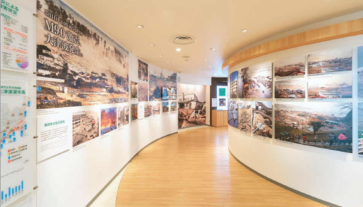
自然災害の恐ろしさを伝える被災写真の数々。見る人の心に、更なる防災意識を呼び起こす。