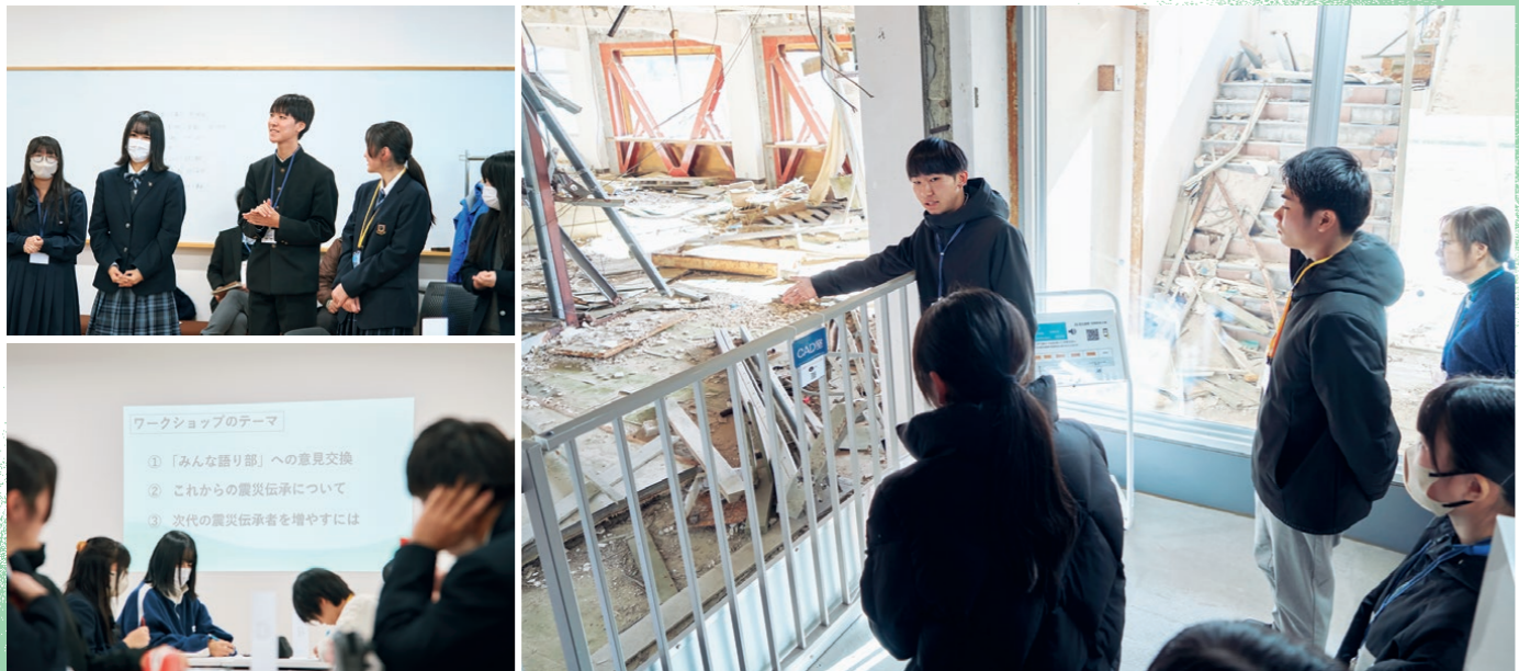
〈右〉気仙沼伝承館の高校生語り部が遺構をガイド。見てほしいポイントが明確に説明されていた。〈左上〉会の冒頭ではちょっとしたゲームがあり、お互い打ち解けた雰囲気。〈左下〉どうしたら震災伝承者を増やせるか、どのグループも活発な意見が飛び交った。