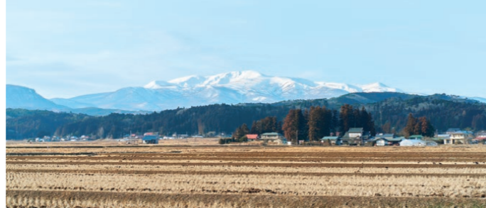
〈上〉廃校を活用したこの施設ならではの、大画面シアター。壁と床の2画面で、床面には靴を脱いで上がることができ、栗原の雄大な景色との一体感を味わえる 〈下〉取材時は雲がなく、くっきりと見えた栗駒山。古くから、この山の雪解け具合を見て田植の準備を行うなど、人の営みと共にある山。