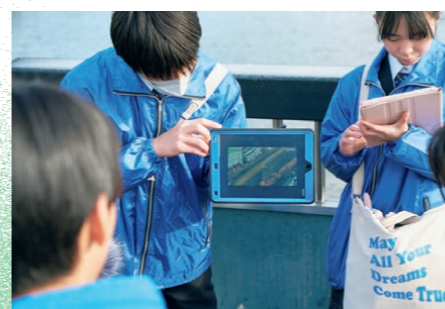
〈右〉多賀城高校が各所に設置した津波到達プレート。まちの高低差や津波の特徴を知ることができた。〈左上〉タブレットも活用したガイドでは、当時の映像なども流しながら、その場所の被害を把握。〈左下〉ワークショップでは輪島高校の生徒もオンラインで参加。現状の課題、何を伝えたいかなどを話し合う。

う反省もあります。次に開催する際は、募集をより広範囲かつ年代を広げてのプロジェクトにできれば、さらに充実した機会にできると感じています。また、課題について意見交換するだけで終わるのもつたいたないので、解決のアクションまでつなげられるようなプログラムにできればより充実するなと思っています。 ——これからボランティアガイドや語り部活動に参加したいと思う中高生に、メッセージやアドバイスをお願いいたします。 「自分は震災を経験していない」や「震災当時の記憶はない・少ないから伝えられない」などの理由で躊躇する方もいるかもしれないです。自分もそうでした。でも、伝承活動をするにあたって必要な資格はありません。このプロジェクトを通して感じたのは、中学生や高校生は震災の記憶がない人がほとんどです。しかし、知らないことを自ら積極的に学び（インプット）、そこで得た学びを自分自身の言葉で