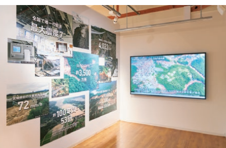
「展示室3 自然の驚異と防災」では、岩手・宮城内陸地震発生時の状況や、専門家による解説を見ることが出来る