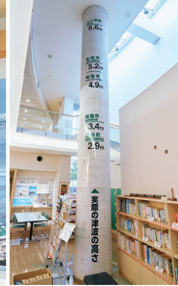
館内にある大きな柱には沿岸部で観測された津波の高さを表示、その巨大な規模を体感することができる。