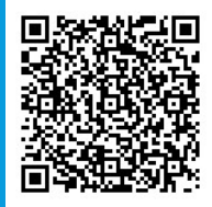
ハンドブック、事例集は、こちらからご利用ください。