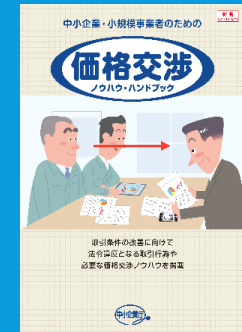
中小企業・小規模事業者のための価格交渉ノウハウ・ハンドブック(令和元年10月改訂)