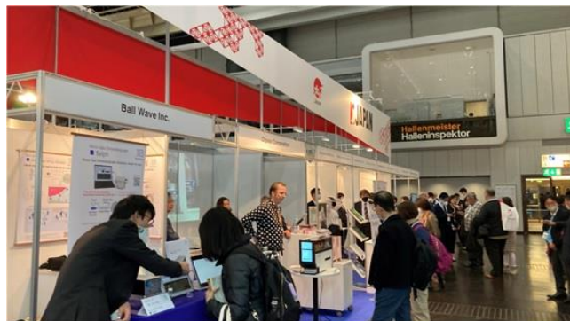
MEDICA 2022ジャパンパビリオンでの様子

ただし、上記の条件に該当する企業であっても他の国庫補助金による支援を受けている場合は、中小企業料金の適用が出来ない場合もあります。必ず補助金の所管部署等へ確認の上、お申し込みください。