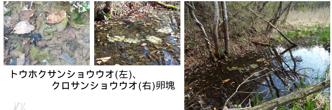
トウホクサンショウウオ(左)、 クロサンショウウオ(右)卵塊

水際はスロープ状の土手にする等移動を阻害しないよう工夫 （サンショウウオ類等のための生息・産卵環境間の移動）