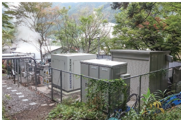
旅館すがわらの裏にあるバイナリー発電所