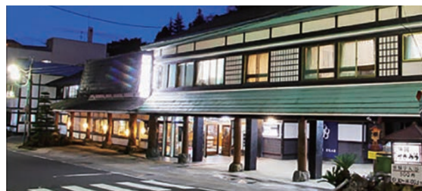
旅館すがわら (外観)

大崎市鳴子温泉にある「旅館すがわら」では、温泉熱を活用したバイナリー発電など、様々な取り組みを行っています。