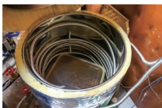
黒ニンニク熟成中・・・