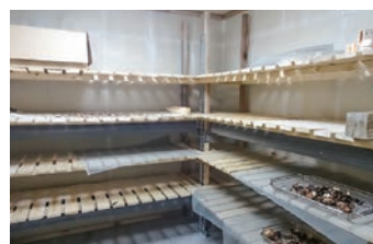
温泉熱を活用した食品乾燥庫

貴重な温泉の恵みを使い尽くしたい! という想いから、バイナリー発電以外にも、温泉熱を使った食品乾燥庫では、しいたけ等を乾燥させ、道の駅で販売しています。このほか、温泉熱で加温して黒ニンニクを作ったり、冬期には管内空調の全てを温泉熱で賄うなど、温泉熱をフル活用しています。