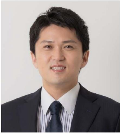
フェンシング選手 (ロンドンオリンピック銀メダリスト)