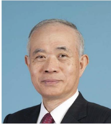
国立研究開発法人産業技術総合研究所最高顧問 株式会社オフィスRC 代表

150周年おめでとうございます。 宮城県で生まれ育った私としても大変感慨深い思いです。 諸先輩方が築き上げてきてくれたこの素晴らしい宮城県の歴史と文化を、これからも共に紡ぎ、盛り上げていきましょう！