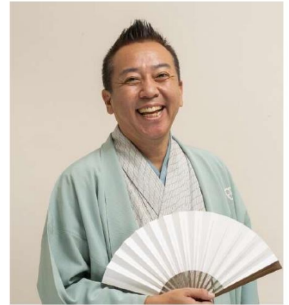
落語家 林家 たい平さん

宮城県誕生150周年 心よりお祝い申し上げます。未曾有の東日本大震災以来復興にむかっての努力に感謝いたします。我がふるさは豊富な自然に恵まれており歴史文化や食材（グルメ）等の魅力を情報発信し発展するよう応援いたします。