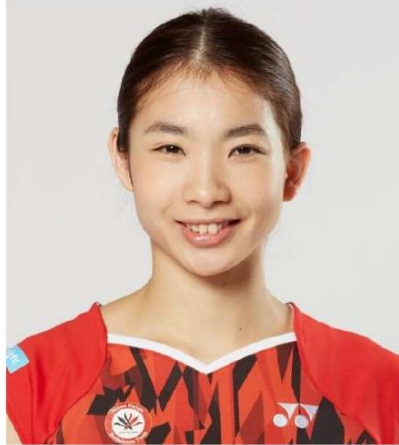
バドミントン選手 (リオデジャネイロオリンピック金メダリスト) 松友美佐紀さん

僕は仙台で生まれ、仙台で育ちました。故郷に帰り親戚や昔の友人と会えると、すごく懐かしい気持ちになります。これからもみやぎ絆大使として、宮城県の魅力を発信し続けられるよう頑張ります。