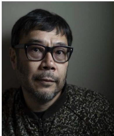
写真家 平間至さん

宮城県誕生150周年おめでとうございます。私も生まれ育ったこの宮城の地で、これまでの様々な歴史や文化がたくさんの人を繋ぐ和として継承され続けますように。益々の宮城県の発展を祈っております。