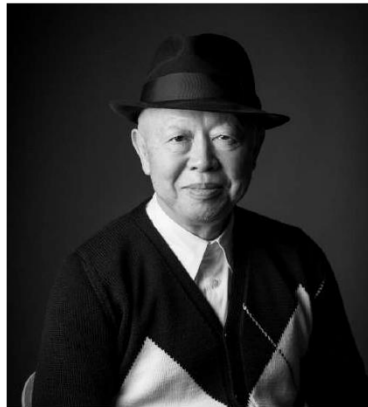
ファッションデザイナー 株式会社ヒロミチ・ナカノデザインオフィス 代表取締役