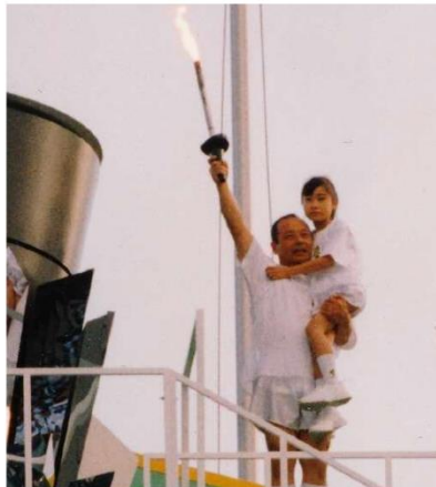
特定非営利活動法人「ゴールドメダリストを育てる会」理事長 (東京・メキシコオリンピック重量挙げ金メダリスト) 三宅義信さん

宮城県150周年おめでとうございます。伝統文化スポーツなど、身近な宮城県はスクスク育って150年。今この伏目の年を迎え、新しい未来に向おうとしています。自然に恵まれた宮城県は、まさに「生まれて来てよかった県」だと思います。これからさらに自立する県に成長できることを祈っています。