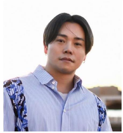
シンガーソングライター

いいぞ 宮城！ 宮城はここ ここは牡鹿半島、ここは蔵王 私が生まれたのはここ 地図を広げると すぐ宮城に目が行く 宮城が褒められるとうれしい 宮城が頑張っていると力が入る 一緒になって拍手をするのが楽しい いいぞ、いいぞ 宮城