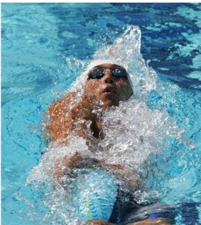
元競泳選手 (アテネオリンピック銅メダリスト) 森田智己さん

宮城県誕生150周年 誠に誇らしく嬉しく心よりお祝い申し上げます。宝塚に入学した17歳の頃から人生の最後は必ず故郷で迎えたい…そう思わせてくれた宮城の地が今迄もこれからも大好きです！！