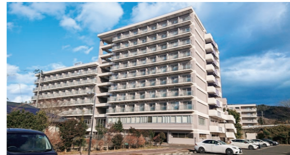
下愛子県職員寮(仙台市青葉区)

世帯用の職員住宅や单身・単身用の職員寮が県内各地に設置され、生活の拠点として利用されています。