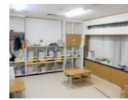
みやぎっこ保育園