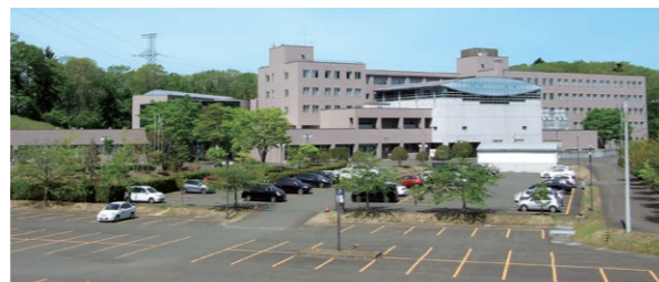
公務研修所(東北自治総合研修センター内)

階層別研修/◎新任職員研修 ◎主査級研修 ◎班長研修 など 選択制研修/◎情報収集分析講座 ◎説明力・プレゼンテーション講座 ほか多数