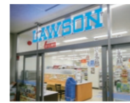
県庁2階コンビニエンスストア